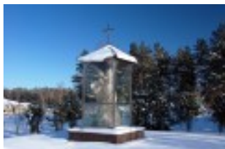
Figura Chrystusa dźwigającego krzyż.